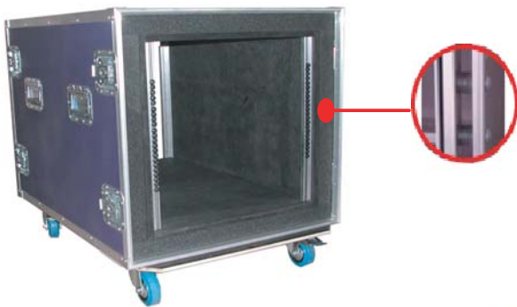
Case-in-Case-System: Innen- und Außencase über Gummipuffer frei schwingend miteinander verbunden, Zwischenraum mit Schaumstoff abgedeckt