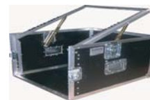
Aufstellrahmen für ergonomische Bedienung oder für Monitore