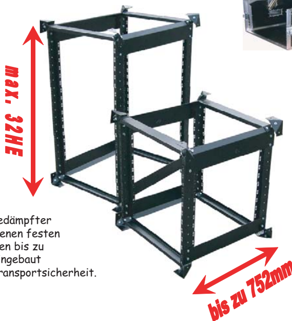
Shock-Mount-Frame-System: Über Gummilager schwingungsgedämpfter Trägerrahmen, der in verschiedenen festen Tiefen bis max 752mm und Höhen bis zu 32HE ausgelegt werden kann. Eingebaut in ein Case bietet dies größte Transportsicherheit.