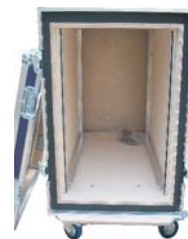
Cases als single, double oder triple door mit Serviceklappen, Kabeldurchführung oder anderen spezifischen Anforderungen